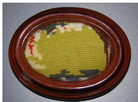
Nålepude med stramaj

Det kan være nødvendigt at undgå det ekstra stykke pap inde i rammen.