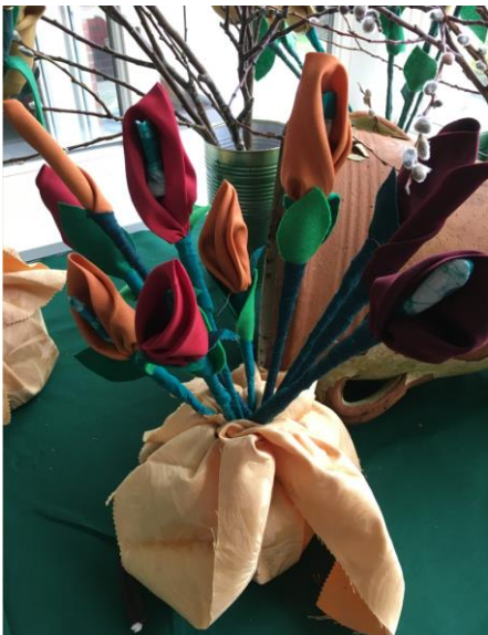
Blad til lilje

14. Blomsterne kan sættes i en vase eller som her en pose med hvedekærner.