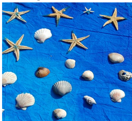
Søstjerner og muslinger