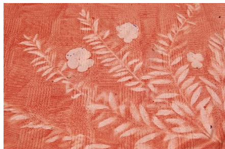
Grene og blomster